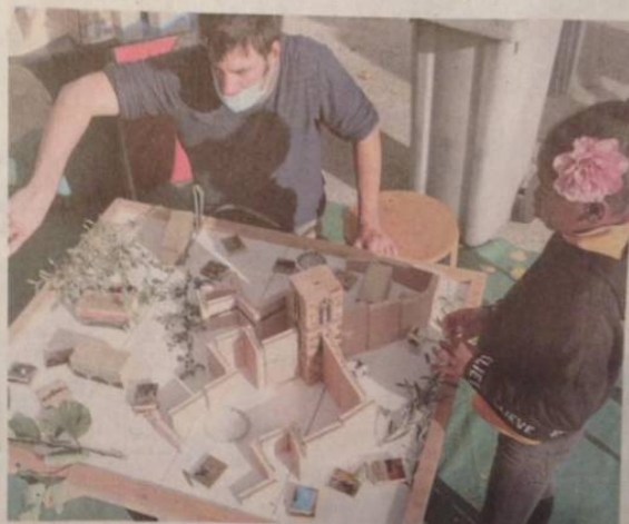
La version extérieure a été présentée et testée pour la première fois mercredi dernier, à la Bouquerie.