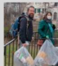
Des bénévoles actifs.