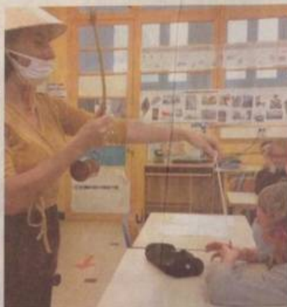
Régulièrement présents sur les berges, les écoliers s'engagent à être des ambassadeurs des rivières.