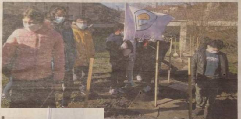
faire des plantations sur les berges de la Soulondres.

Cette année, les CM1-CM2 de l'école Prosper-Gely travaillent sur le thème des arbres et de la biodiversité dans le cadre du projet pédagogique Arboëbio, alliant arts plastiques et sciences. Joignant la théorie à la pratique, ils sont venus à plusieurs