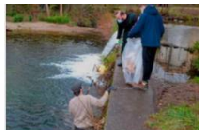
La traque s'est faite dans les moindres recoins de la rivière.