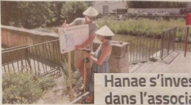
Un panneau d'information en bois a été installé par l'association.