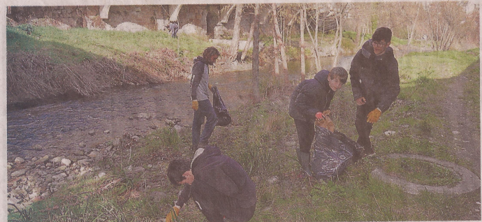
Les berges de la Lergue et de la Soulondres ont été nettoyés de tous leurs débris divers et variés... jusqu'à un canapé !