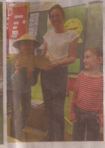
Le bout de bois gravé de retour à l'école.