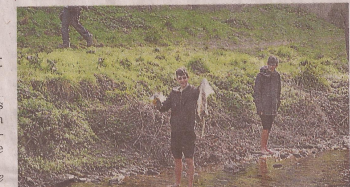
Les plus jeunes n'ont pas hésité à mettre les pieds à l'eau.

Œuvre d'Eau propose toute l'année des activités auprès du grand public et des scolaires sur les berges, et fera samedi 18 et dimanche 19 juin sa grande manifestation Rivières en fête. De quoi profiter plus positivement de ces deux trésors qui encadrent la vieille ville.