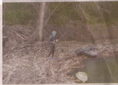
Le nouveau a été retrouvé sur un embâcle de plusieurs tonnes de bois morts, en bord d'Hérault.