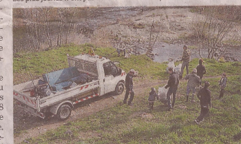
Le camion a très vite été rempli par la collecte du jour.